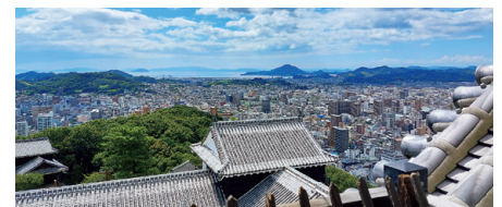
松山城から望む松山市内