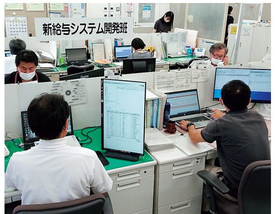
岡山県出納局内部事務課での端末操作

仕様決定やテスト、新システムでの運用立ち上げ等の開発全般において、岡山県様のご協力もあり、予定通り本稼働することができました。また、「短時間勤務職員に対する共済適用拡大」（令和4年10月施行）等の制度改正については、開発フェーズ終盤から開発と並行して対応を進めており、令和4年9月にリリースします。今後は、「定年の引上げとそれに伴う諸制度の施行」（令和5年4月施行）への対応も順次行っていく予定です。