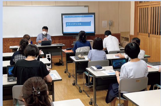
訪問指導・研修の様子

各学校を訪問し、ICT活用に係る訪問指導・研修を実施します。事前のアンケートを基に実施内容を協議した上で、7月から訪問を開始しています。