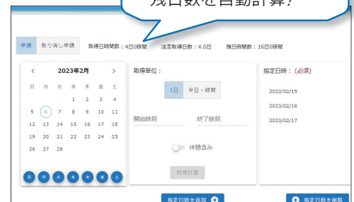
年次有給休暇申請画面