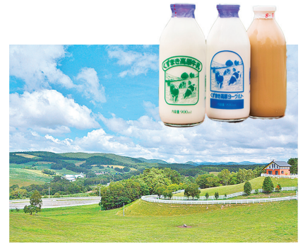
くずまき高原牧場と牧場の恵みを受けて生産される牛乳等

北緯40度、連なる1,000m級の山々に囲まれ、広大で多様な高原を有する葛巻町は東北有数の酪農郷。日本一の公