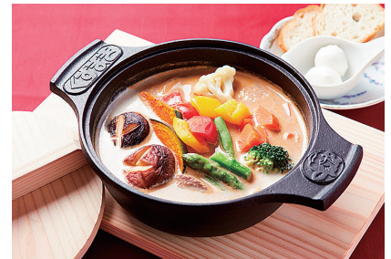
くずまき鍋(モッツアレラチーズ入り味噌ミルク仕立て)

また、 ひらにわ 県立自然公園の「平庭高原」は日本最大規模・およそ30万本の白樺林とレンゲツツジの群生地として知られ、特産の山ぶどうをふんだんに使用した「くずまきワイン」の生産地でもあります。