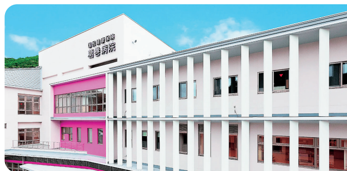
ミルク(白)とワイン(赤)をイメージした外観

今後もアイシーエスは、ご満足いただけるサービスの提供と業務の効率化や患者サービスの向上に貢献する提案で、お客様のご期待にお応えできるよう努めてまいります。